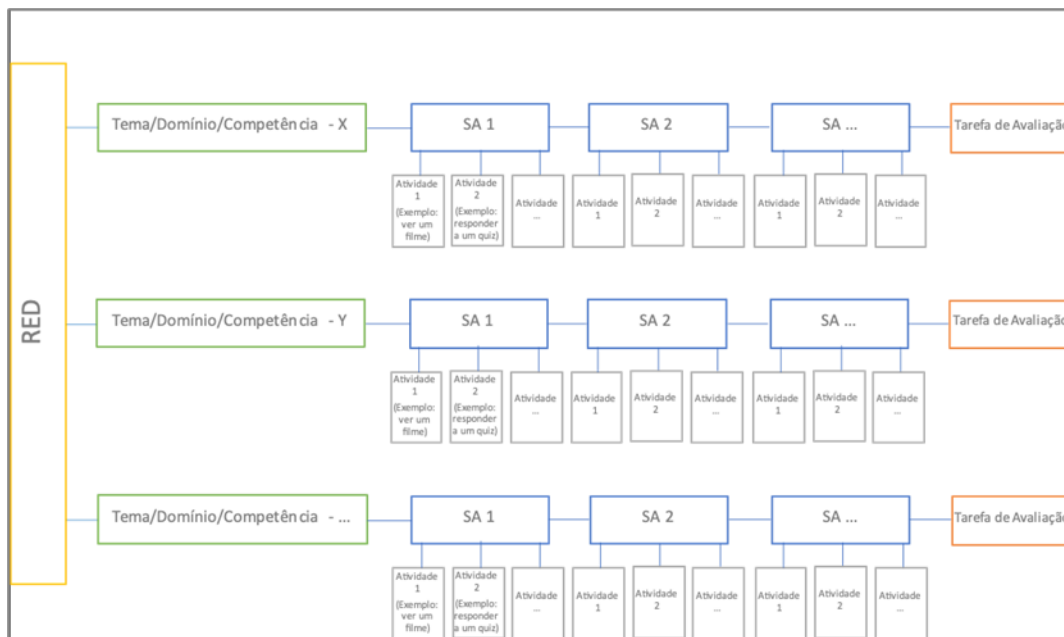
Figura 1: Composição de um RED (ilustrativo)