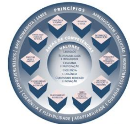
Figura 1 – Esquema conceitual do Perfil dos Alunos à Saída da Escolaridade Obrigatória.